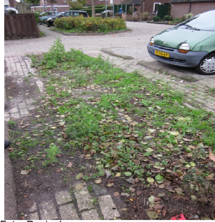
Parkeervak, Haven