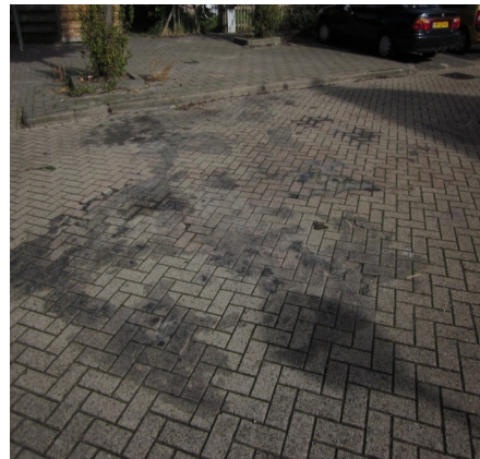
Vuurwerk- en kerstboomverbrandingsplek in Waterwijk Ambtelijk was beslist om reparatie van de schade voor onbepaalde tijd uit te stellen, omdat bewoners zich tijdens de jaarwisseling van 2012/2013 niet hadden gehouden aan afspraken. In januari 2014 is de bestrating hersteld.

Tot slot zijn in de woonwijken veel brandgangen, achterafpaadjes en openbare parkeervakken die vaak lastig te onderhouden zijn. Bij brandgangen is het logischerwijs moeilijk manoeuvreren met onderhoudsmaterieel (zie foto 6). Bij brandgangen speelt bovendien dikwijls de vraag wie eindverantwoordelijk is voor het onderhoud (gemeente, corporatie of bewoner). Ook parkeervakken hebben vaak obstakels, waardoor onderhoudsmachines er moeilijk bij kunnen (zie foto 7).