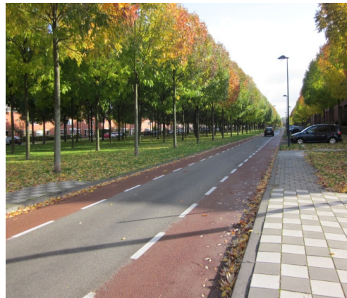
Ruim en in strakke lijnen opgezet, Landstrekenwijk

In dergelijke woonwijken is het aanbod goedkope woningen relatief groot, waardoor er instroom is van kwetsbare groepen en/of van groepen met een leefstijl die afwijkt van die in 'duurdere' wijken. Een gevolg is dat in deze wijken groepen mensen wonen die minder betrokken zijn bij de (fysieke)