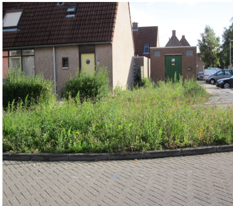
Ongemaaid groen vanwege komende herstructurering van de openbare ruimte, Boswijk