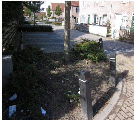
Zwerfvuil, Waterwijk